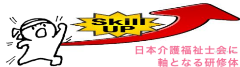
日本介護福祉士会における軸となる研修体系